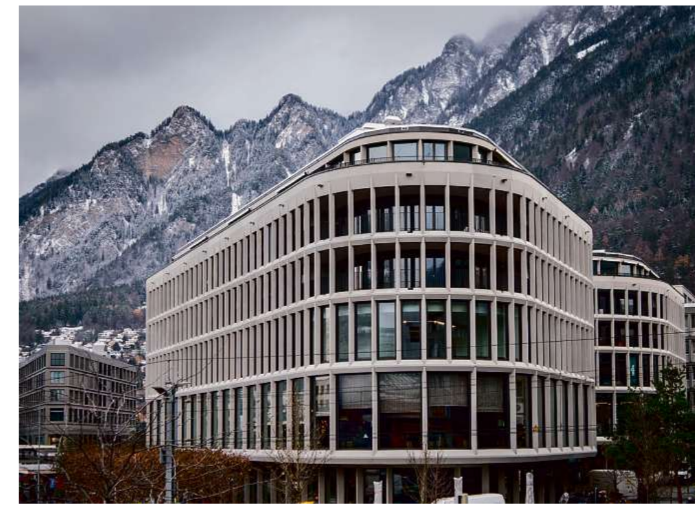
Wohn- und Geschäftshaus Steinbock