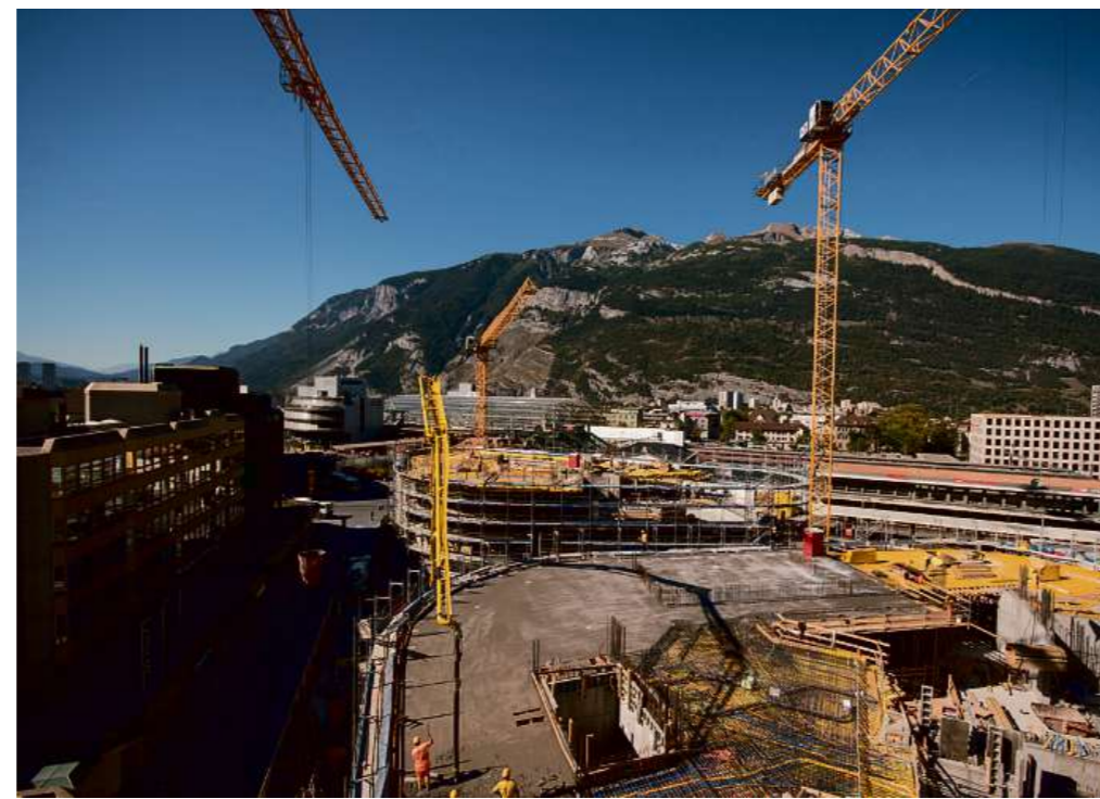
Grossbaustelle Steinbock Oktober 2018

Die ortsbauliche Grundidee bestand darin, den ursprünglich vorhandenen, schwerfälligen Blockrand aufzulösen, die Sichtachsen zu öffnen, damit die Orientierung zu erleichtern und last but not least die Steinbockstrasse aufzuwerten. Zwei markant gerundete Baukörper besetzen das Geviert und akzentuieren ein Eingangstor zum innerstädtischen Herzen von Chur. Die offenen Blickachsen lassen die spezielle Lage des Gebäudes in der Ebene des Rheintals zwischen den steil aufragenden Bergzügen spürbar werden. Die Verbindung zur Steinbockstrasse schafft eine neue Durchlässigkeit, zwischen den beiden neuen Gebäuden entsteht ein spannender Aussenraum mit Aufenthaltsqualität. Das Erdgeschoss ist als Schaufensterfassade konzipiert, das 1. Obergeschoss krägt schützend aus und ist für Passanten gut einsehbar. Die darüberliegenden