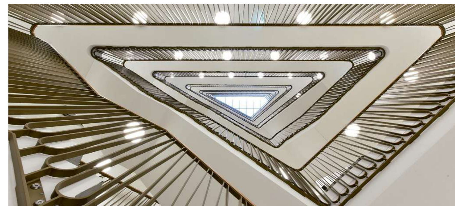
Treppenhaus im Steinbock

Eiffage Suisse AG Geschäftsstelle Chur Ringstrasse 34 CH-7000 Chur Tel.: +41 81 258 20 80 E-Mail: gr.ec.suisse@eiffage.com www.eiffage.ch