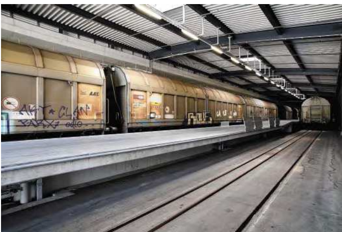
Höhenverschiebbare Bahnverladerampe für den Güterumschlag zwischen SBB und Rhb.

Gilgen Logistics AG Im Grüt 1 4225 Brislach Telefon 061 785 85 85 Fax 061 785 85 79 info@gilgen.com www.gilgen.com