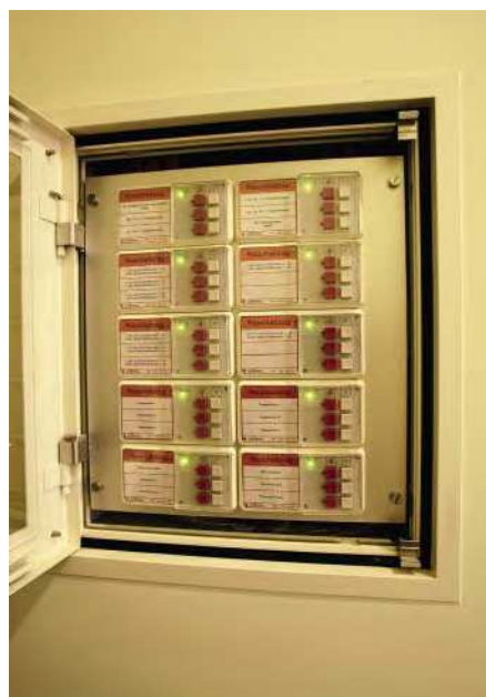
Ausführung der RWA Koordination, Foppa AG, Chur