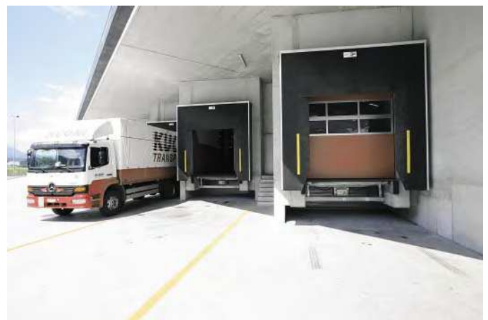
Anpassrampen für ein flexibles, rationelles und sicheres verladen.