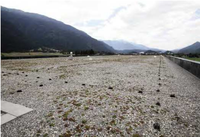
Die Firma STU-DACH wurde beauftragt die Flachdacharbeiten auszuführen. Die Herausforderung wurde mit Freude angenommen. Es ist uns gelungen in der kurzen Bauzeit, die 6000 m 2 Abdichtung, die Isolation und die Begrünung einzubauen. Die Spenglerarbeiten wurden in CNS ausgeführt und in derselben Zeit erstellt. Haben Sie schon ein STU-DACH? Wir stehen für Kompetenz in der Gebäudehülle.